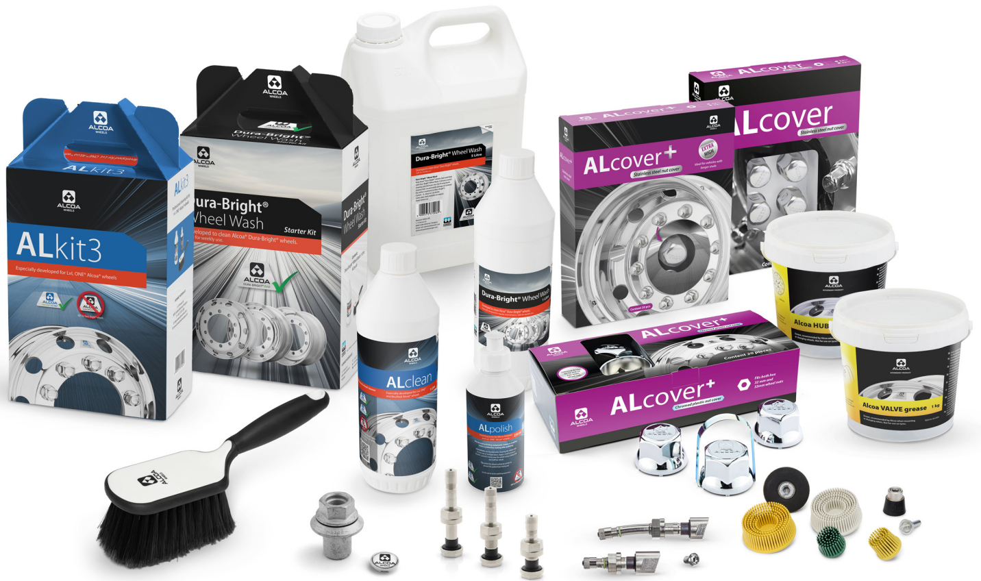
Zubehör zur Pflege der Alcoa® Wheels Accessoires pour l'entretien des jantes Alcoa® Wheels